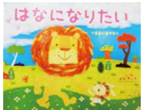
「はなになりたい」作・絵：*すまいるママ* 出版社：東京書店

人と人との結びつきを大切にしていきたいと誰もが思う今の時代だからこそ、豊かな言葉を紡ぎだせる、またその言葉で人とつながっていける子どもたちを育てていくために、読み聞かせや朗読を教育の場で生かしてみようでしょうか。